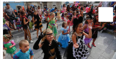
Carnaval de verano en Luanco