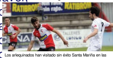
Los arlequinados han visitado sin éxito Santa Mariña en las

Los comentarios están sujetos a moderación previa y deben cumplir las Normas de Participación