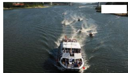
Recibirán la Compostela aquellos tripulantes que hayan completado más de 90 millas náuticas.

Con motivo en este 2014 de la conmemoración del peregrinaje de San Francisco de Asís a Compostela las comunidades jacobea y franciscana han puesto en marcha la organización de un evento de alcance internacional que tendrá a la ría de Arousa y al río Ulla como elementos destacados.