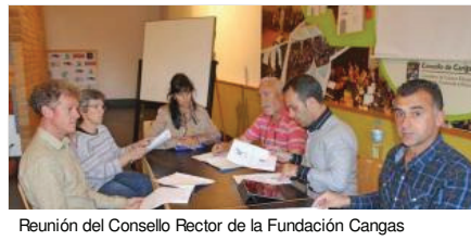
Reunión del Consejo Rector de la Fundación Cangas