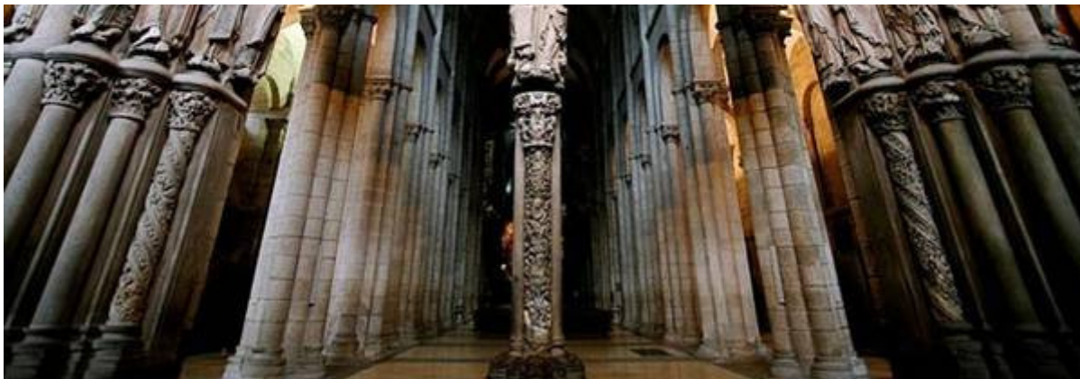
Portico de la Gloria, Santiago de Compostela